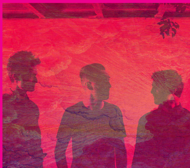
© Photo Lorenzo Naccarato Trio | Émile Sacré - BakClite - Graphisme | StCéphane Roqueplo

La ville d'Albi, en partenariat avec le Goethe-Institut, présente une rencontre inédite entre le jazz franco-italien et le jazz allemand. Deux formations recherchées par le public pour leurs univers musicaux respectifs, avec la magie de la découverte de l'autre et une création commune unique.