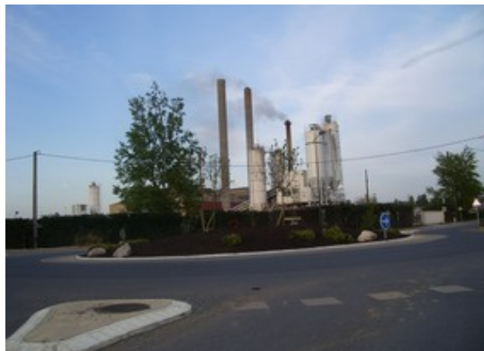
Rond point interne à la ZAC

Le schéma d'aménagement définit un principe de voirie permettant le bouclage de la rue Jean Henri Fabre avec la rue Evariste Galois afin d'assurer la desserte de la partie Ouest de la zone restant à aménager. La commune a donc inscrit un emplacement réservé de voirie (n°108) de la voie interne permettant cette continuité. La largeur d'emprise minimale projetée pour le système viaire est de 10 mètres.