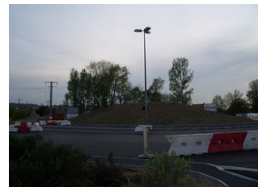
Rond-point d'entrée pôle d'activité

L'aménagement du carrefour giratoire Route de Millau / Rue d'Arsène d'Arsonval constitue l'entrée principale à la zone d'activité de Montplaisir et est le point singulier de ralentissement des automobilistes provenant de la RD999.