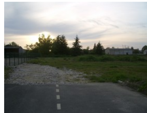
Bouclage des terrains lotissement communal

Le chemin des sapins sera raccordé sur cette nouvelle voirie et son accès existant sur la RD 999 sera supprimé en raison de sa dangerosité .