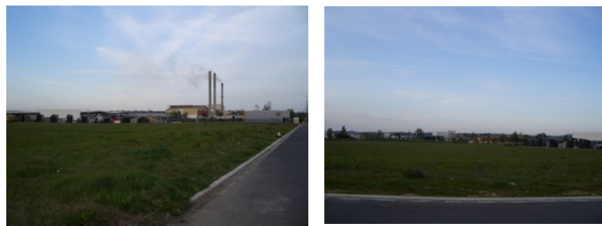
Zone AUa2 de Montplaisir

Afin d'étendre les capacités d'attractivité de la ville d'Albi, le PLU a classé le présent secteur en zone AUa2 . Ainsi, il ne peut recevoir que des équipements destinés à l'activité économique et industrielle . L'implantation de nouvelles entreprises dans un cadre largement construit, a pour ambition de renforcer le dynamisme du pôle d'activité Est de la commune .