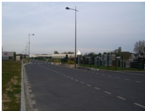
Voirie de desserte interne