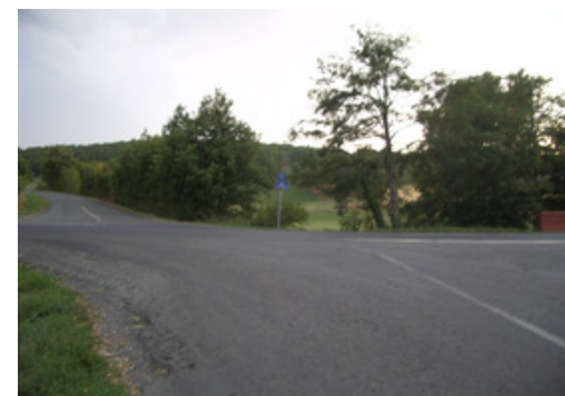
Carrefour Route de Teillet/chemin de Lavour nord

Une coulée verte est préservée en bordure du ruisseau de Falcou.