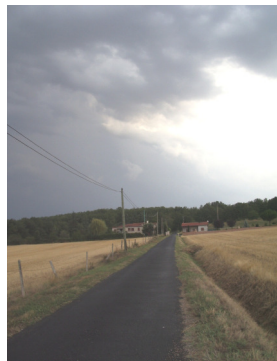
Chemin du Château d'eau