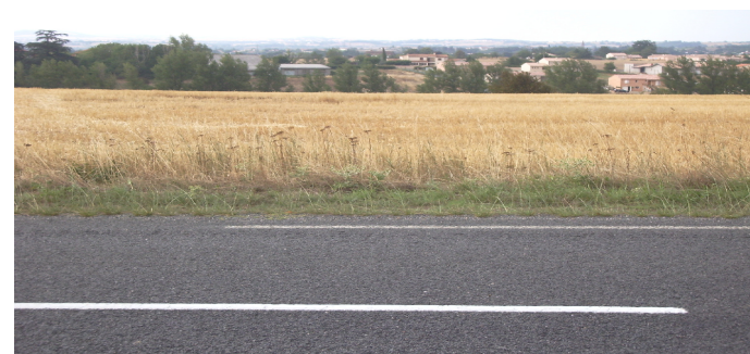
Route de Teillet, zone AU au sud du secteur

Au Nord de la zone, les études de prospective urbaine ont défini un emplacement réservé n° 99 afin de prolonger le chemin de La Bane et d'assurer son bouclage au niveau de RD 69. Cette nouvelle voie permettra de rejoindre la route de Teillet de manière plus sécurisante. Les riverains doivent actuellement emprunter le carrefour route de Teillet / Chemin de La Bane qui reste un point sensible en raison du manque de visibilité.