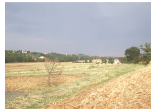
Emplacement réservé en vue de l'extension du chemin de la Bane