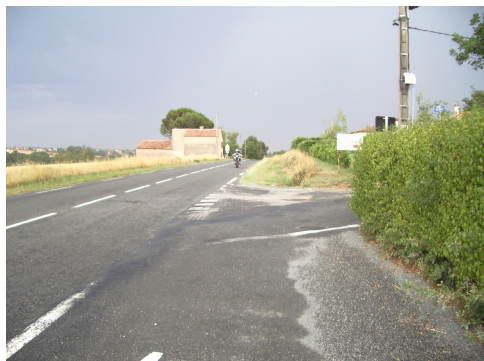
Carrefour Route de Teillet / chemin du Roc

Coupé par la route départementale RD81, ce secteur doit comporter des accès secondaires sécurisés à partir de cet axe majeur. Par conséquent, il s'avère nécessaire de renforcer la sécurité des carrefours et de réduire les accès existants débouchant sur la route de Teillet.