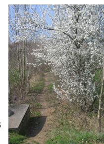
Chemin piétonnier de liaison en Mas de Blanc et Atlantis