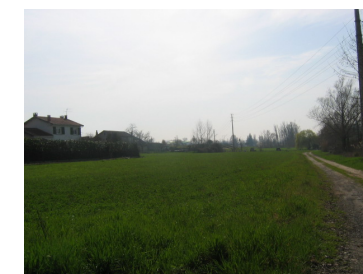
Zone inondable au PPR, futur bassin de rétention

Une attention particulière doit être portée sur la gestion des eaux pluviales, en créant un bassin paysager dans la zone inondable pour récupérer les eaux d'infiltration. Cet espace pourra être transformé en corridor écologique, qui constituera une zone tampon entre le site et les quartiers environnants.