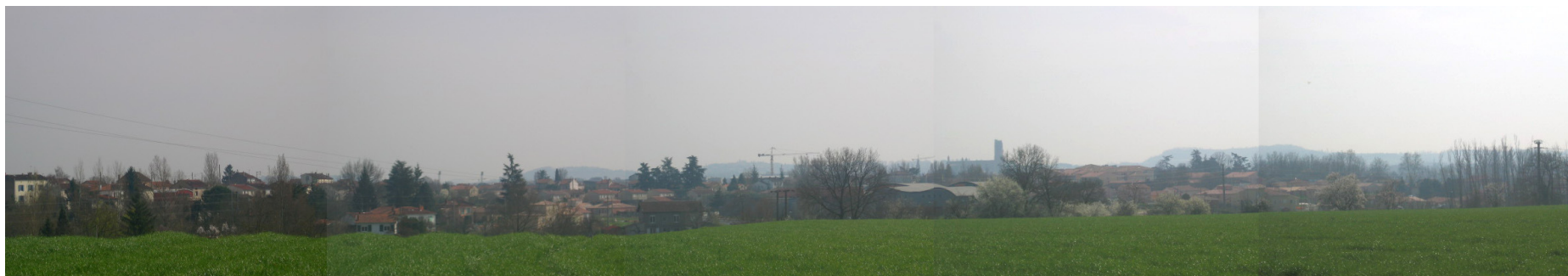
Vue sur Albi depuis la Zone 2AU

Le site présente une grande ouverture visuelle vers le sud-est ; l'organisation des lots devra veiller à préserver les vues lointaines sur les coteaux et la cathédrale pour garantir un cadre de vie agréable. A l'inverse, une ligne de bâti cohérente doit être créée sur les coteaux du site, il s'agira d'adapter la topographie du bâti à celle existante pour garantir une complémentarité harmonieuse entre le projet architectural et le site.