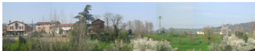
Hameau Mas de Blanc et Zone 2AU vue de l'avenue des Fontanelles

Pour assurer une bonne distribution de la zone et la relier aux principales voies de communication (route de Cordes, Avenue de Péliissier), les voies existantes devront être requalifiées . Ainsi, Le chemin de Mas de Blanc fait l'objet d'un emplacement réservé (n°103) afin d'établir une connexion avec le giratoire Route de Cordes/Avenue des Fontanelles . La liaison entre le chemin de Las Bories vers l'avenue de Péliissier est assurée par un emplacement réservé modulable n°F. Afin de sécuriser l'ensemble de la future zone d'habitat, le schéma d'aménagement envisage de supprimer l'accès existant au carrefour du chemin de Saint Sernin/Route de Cordes en raison de sa dangerosité .