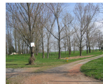
ER modulable pour la future de voie de desserte de la Zone 2AU