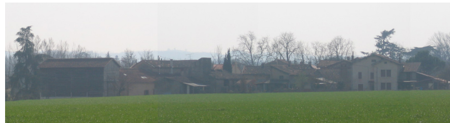
Morphologie du hameau de Mas de Blanc

L'implantation d'un pôle de services , dédié aux services à la personne est à réfléchir pour favoriser la multiplicité des fonctions urbaines et constituer une centralité complémentaire au sein du quartier. Celui-ci pourra être situé au carrefour entre le chemin de Saint Sernin et la future voie desservant la zone AU afin de permettre une grande accessibilité par tous.