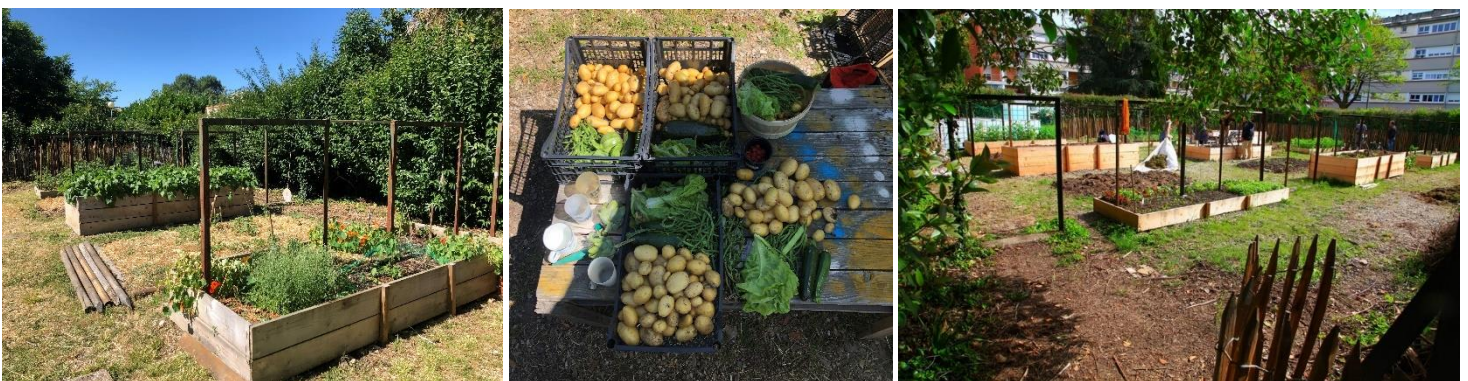
Le jardin solidaire et collectif de Lapanouse

Les 10 parcelles individuelles qui complètent le jardin sont toutes occupées, et la partie centrale collective a accueilli plusieurs événements festifs et conviviaux qui ont rassemblé de nombreuses personnes.