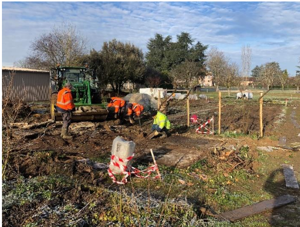
Les jardins familiaux potagers de Saint Viateur pendant les travaux