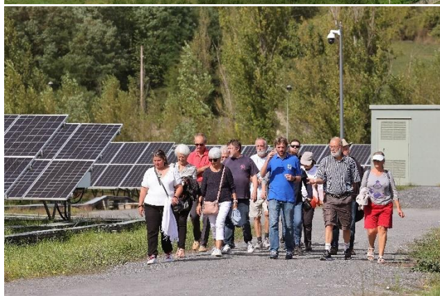
L'inauguration de la centrale Solaire de Pélissier