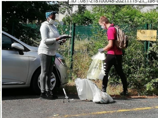
Les journées vertes citoyennes

Des animations pédagogiques à destination des scolaires ont été également organisées. Cette année, ce sont 28 classes soit 600 élèves qui ont bénéficié d'animations ou de sorties pédagogiques en lien avec la biodiversité. Dans ce cadre, la Ville a procédé à l'acquisition de maquettes particulièrement réalistes représentant différents petits animaux, amphibiens et reptiles principalement. Ce petit matériel pédagogique permet aux enfants de visualiser concrètement ces animaux.