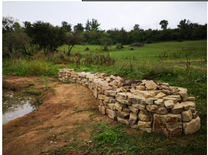
Le chantier participatif pour la création du mur en pierre aux abords de la mare de Lavazière

La collectivité procède également à des acquisitions foncières dans le but de consolider la trame verte et bleue du territoire et de créer des réservoirs biodiversité.