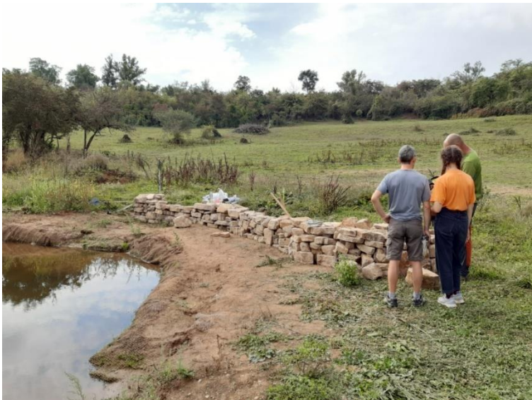
La nouvelle mare de Lavazière et les refuges à amphibiens et reptiles

Des refuges pour reptiles et amphibiens ont également été installés à proximité de la mare de Lavazière.