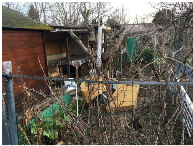
Les jardins familiaux potagers de Saint Viateur avant le lancement des travaux