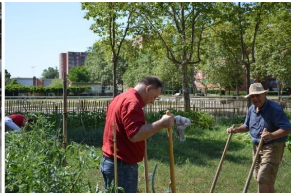
Les jardins du square Augereau

La Ville d'Albi a également entamé un important travail portant sur le réaménagement des jardins familiaux de Saint Viateur, sur le quartier de Cantepau.