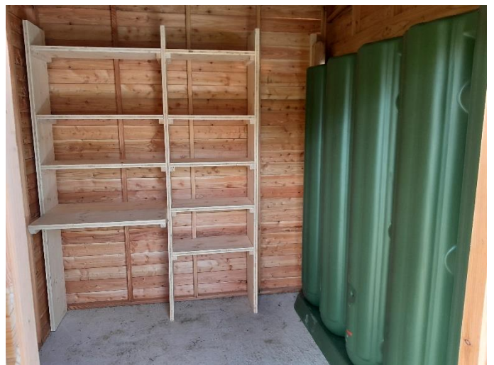
Les jardins familiaux potagers de Saint Viateur après les travaux (phase 1)