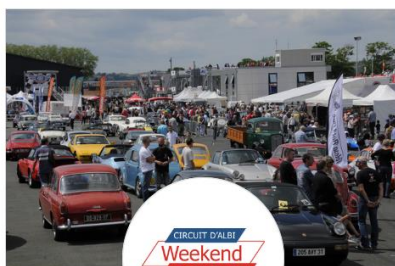
Week-end Retro 60e anniversaire