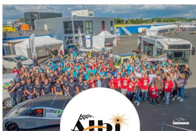
Albi Eco Race - 4e édition