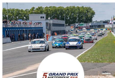
5e Grand Prix Historique d'Albi