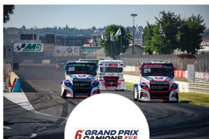
6e Grand Prix Camions d'Albi