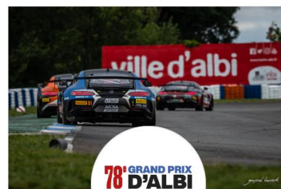
78e Grand Prix d'Albi - FFSA GT