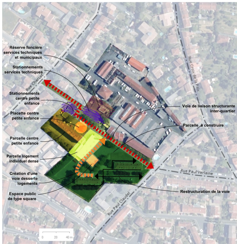
Intentions et principes de projets

Site de Charcot Intentions et principes de projet