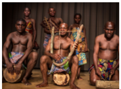
Quelques artistes invités pour riverrun, #5