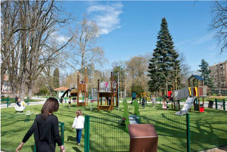
L'aire de jeux renovée

Les conseillers soulignent la rénovation de l'aire de jeux pour enfants très appréciée et utilisée.