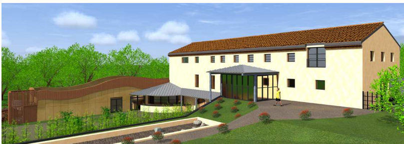
vue de la façade arrière avec les jardins privés – Echappée verte

Son objectif premier est de favoriser, d'entretenir et de développer les liens familiaux en Albigeois, indispensables au bien vivre ensemble, par la mise à disposition d'espaces de réception adaptés et spécifiquement dédiés à l'accueil d'événements conviviaux et accessibles à toutes les familles quelque soit leur situation sociale.