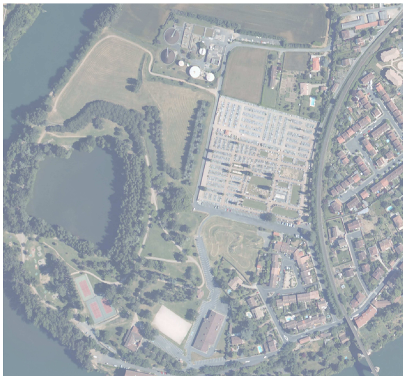
Vue aérienne du site de Pratgraussals

Dans la continuité du projet de passerelle piétonne en encorbellement sur le viaduc ferroviaire, il est rappelé aux conseillers que la ville d'Albi mène une réflexion sur le devenir du site de Pratgraussals.