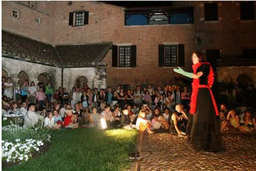
Des animations pour tous en cœur de ville

De même un calendrier des ouvertures dominicales est en cours d'élaboration avec l'association les vitrines d'Albi : la détermination des dates et des animations est en cours. La Ville enregistre un retour positif des commerçants qui jusqu'à présent ont tenté l'expérience.