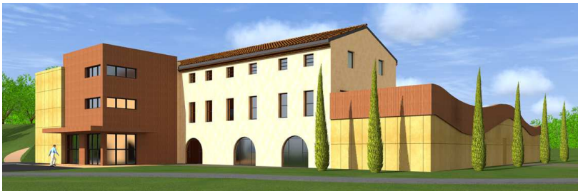
vue de la future façade avant – rue de la Mouline