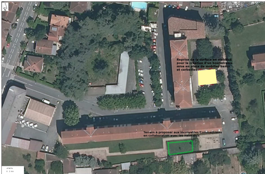
Schéma de principe d'aménagement

Suite aux travaux de rénovation des immeubles, Tarn Habitat a remis en état les espaces verts où étaient positionnées les installations de chantier. L'objectif est d'accompagner les travaux de réhabilitation réalisés par Tarn Habitat par une intervention de la ville sur les espaces verts à l'arrière des immeubles.