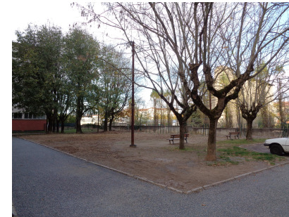
Zone destinée à l'aménagement d'un bouldrome

Les conseillers sont favorables à l'aménagement du bouldrome à l'arrière de l'immeuble le plus haut.