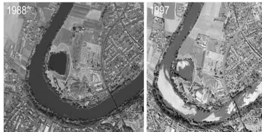
1988 / Ouverture de la base de loisirs : cheminements, plantations et programmes sportifs (tennis...). Plantation de l'allée de pins parasols 1997 / le terrain de bicross et la frange boisée côté cimetièrre apparaissent.

- Synthèse du diagnostic de la base de loisirs et des deux équipements : atouts, limites, points de vigilance (présence d'habitations à proximité, intégration paysagère des bâtiments, équilibre de la biodiversité, accessibilité...)