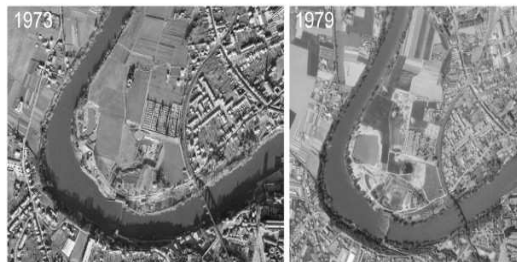
1973 / Exploitation de gravières : à l'Est et à l'Ouest du site se modèlent une topographie qui servira de base pour les futurs plans d'aménagement de la base 1979 / L'ancienne gravière servira pour le futur plan d'eau et l'apparition de la station d'épuration