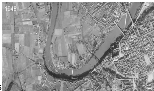
1948 / Prat-Graussals : des terres agricoles

La Ville a aménagé la base de loisirs en 1988, sur des terrains (12 ha) acquis en 1981.