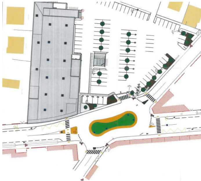
Plan projet de l'aménagement