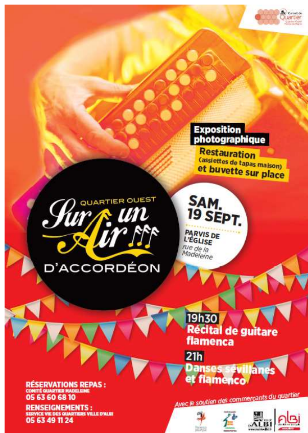
Projet de visuel non définitif de la manifestation